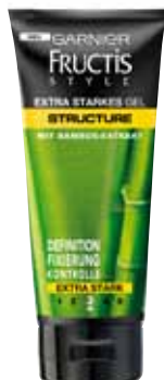
Garnier Fructis Style STRUCTURE LOOK Fixier-Gel