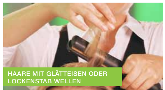
HAARE MIT GLÄTTEISEN ODER LOCKENSTAB WELLEN

4. Nun die Haare sorgfältig vom Ansatz bis zur Spitze mit dem Glätteisen oder Lockenstab wellen, um das spätere Hochstecken zu vereinfachen.